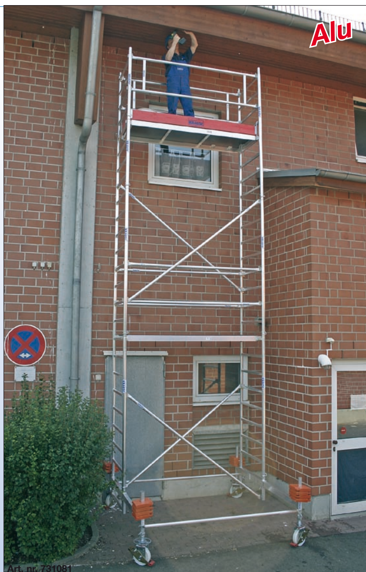
Art. nr. 731081

Important: În funcție de varianta de execuție se vor utiliza contragreutăți (accesorii).