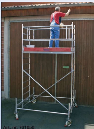
Art. nr. 731050